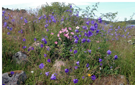
Stor blåkllocka, Säby ö