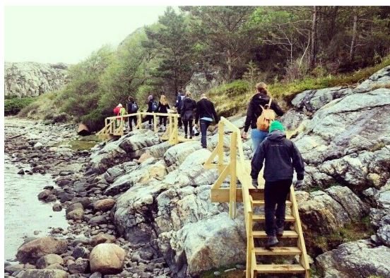
Trappor underlättar vägen till Björshuvudet.

Vårt ideella arbete med röjning, räfsning och eldning av ris har sedan fortsatt under 2014 och under året har vi haft fem arbetsträffar. Det har känts väldigt positivt att 35 olika medlemmar deltagit en eller flera gånger. Tillsammans har vi gjort mer än 300 arbetstimmar sedan projektets start och vid årsskiftet var cirka 60 procent av området färdigröjt. Området är mycket svårtillgängligt och vi har därför med hjälp av pengar som anslagits av SNF låtit bygga en bro över en bäck och trappor över de mest besvärliga och hala partierna på klipporna.