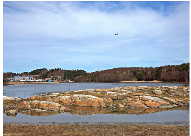
Almön, "Tjörns entré"

Plangruppen har också svarat på remissen om riksintresse friluftsliv, och deltagit i försvaret av det utvidgade strandskyddet.