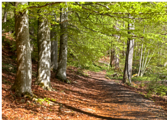
Vårgrönska i Sundsby.

Flera medlemmar strandstädade Kaurö tillsammans med Strandstädarna 12 och 21 september. Tjörns viktigaste fågelö måste vara skräpfri!