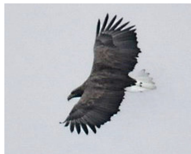
Havsörn.