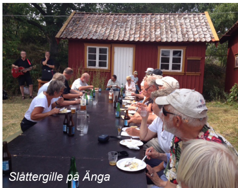
Slättergille på Änga

I naturreservatet vid Brevikskile har vi genomfört fyra arbetspass med röjningar plus en dag med strandstädning då hela området städades. Vi har i slutet av året besiktigat hela Toftenäs – Breviks kile – Säby kiles naturreservat och sammanställt resultatet till Västkuststiftelsen.