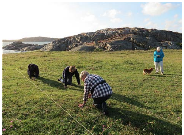
Inventering på Björshuvudet.

Den 14 maj gjorde vi en exkursion till området för att se på blomningen då även Halsbäcks intresseförening var inbjuden. I augusti kunde vi konstatera att kustgentianorna hade återkommit vilket var det huvudsakliga målet för restaureringen. 2 600 exemplar blommade väster om skalgrusgropen och på motsatta sidan av gropen blommade rikligt med sumpgentiana.