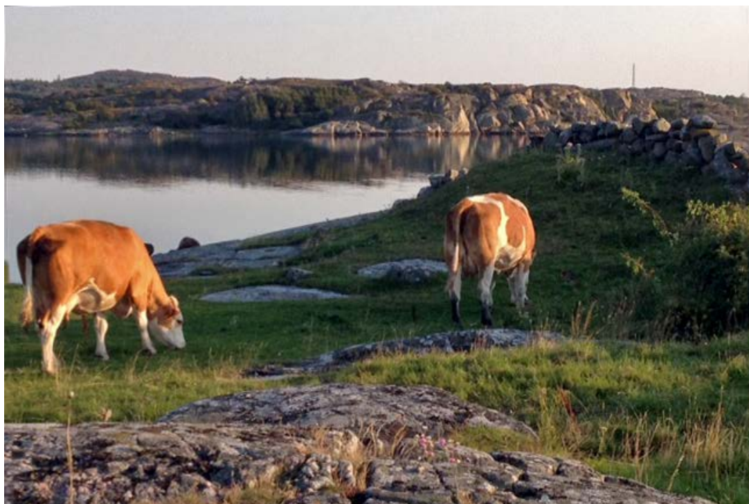
Betande kor.

Vid olika tillfällen har styrelsen också haft besök av medlemmar, och andra, som på olika sätt bidragit på olika sätt till arbetet. Styrelsen har haft fortsatta kontakter med företrädare för kommunen för att överlägga om olika naturvårds- och miljöskyddsfrågor. Föreningen har också medverkat i ett möte med Länsstyrelsens naturvårdare i december, och möjligen kommer det bli en fortsättning på det mötet. Föreningens synpunkter har även under det gångna året fått utrymme i massmedia, vilket gett tillfälle att visa på den bredd av aktiviteter som finns inom föreningen. Föreningen arrangerade bland annat en välbesökt politiker-hearing under hösten som fått uppmärksamhet i media.