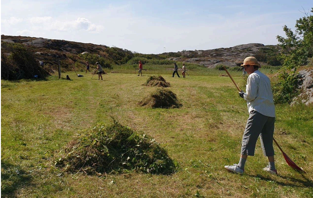
Slätter på Härön

Tjörns Naturskyddsförening är en demokratisk och ideell förening som utgör en krets av Naturskyddsföreningen, med syftet att värna, vårda, och visa på naturen och dess behov av hänsyn i vid bemärkelse. Nationellt hade Naturskyddsföreningen sammanlagt drygt 213 000 medlemmar under 2024. TNF hade vid årets slut 390 medlemmar. Lokalt innebär detta en liten minskning från föregående år. I relation till befolkningen är Tjörns Naturskyddsförening en relativt stor krets, med en större andel medlemmar av befolkningen än till exempel Göteborg.